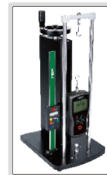
Digital Messsystem (optional)